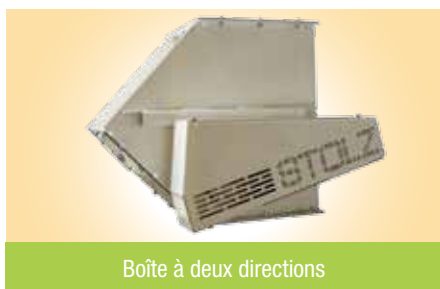
Boîte à deux directions

La conception est telle que tous les circuits non utilisés sont obturés : pas d'intercommunication possible entre les circuits (pas de contamination croisée et pas de transmission d'une éventuelle explosion).