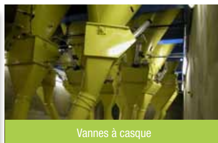
Vannes à casque