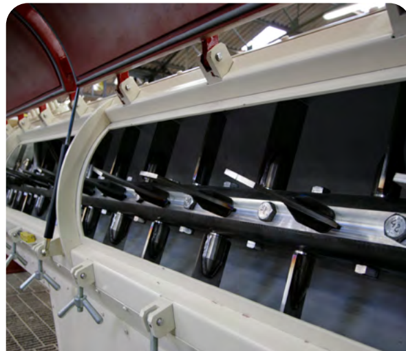
Rotor et palettes du malaxeur horizontal longue durée