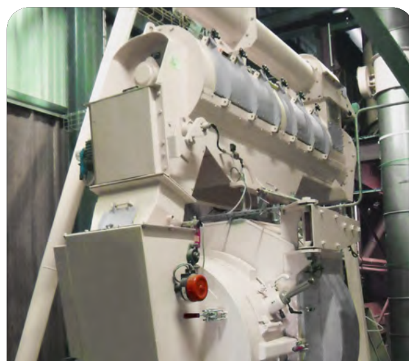
Malaxeur horizontal longue durée sur presse à granuler