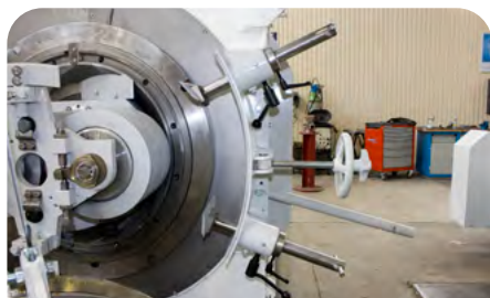
Supports couteaux fixes