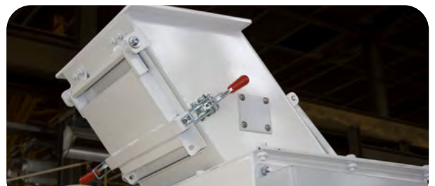
Plaque magnétique sur goulotte d'alimentation