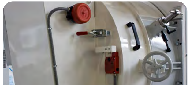
Sécurité sur portes électriques