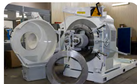
Treuil intégré pour manutention de la filière