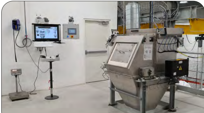
Installation complète avec auget et automatisme