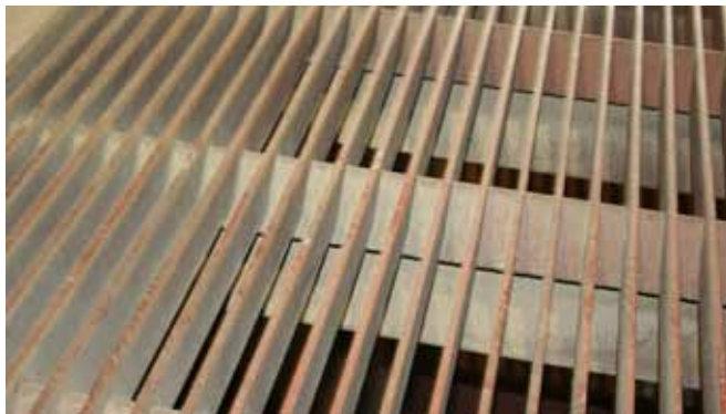
Grille avec structure renforcée